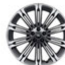
22" 钻石切割亮光深灰铝合金轮毂 - 样式1075