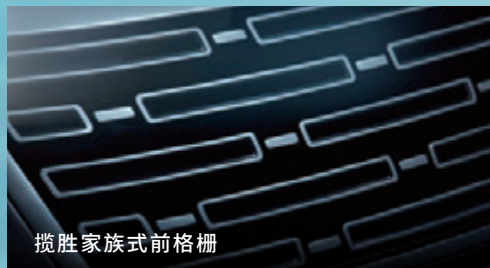
揽胜家族式前格栅

首发色扎尔达灰、瓦雷泽蓝、阿霍约斯灰在内的定制车色多达9种，为优雅本色激活不拘个性。