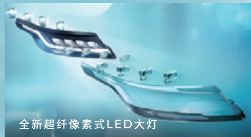
全新超纤像素式LED大灯