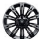
22" 亮光黑铝合金轮毂 - 样式1075