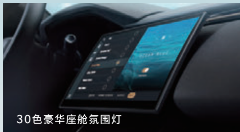
30色豪华座舱氛围灯

30色智定义多彩氛围灯随心而变，尊贵格调环抱而生。高级车内空气净化系统，有效过滤PM2.5、监测二氧化碳浓度，打造无微不至、心旷神怡的健康呼吸。