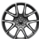
21" 钻石切割哑光深灰铝合金轮毂 - 样式5109