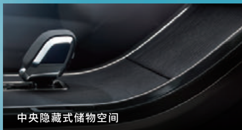
中央隐藏式储物空间