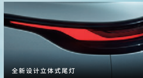
全新设计立体式尾灯