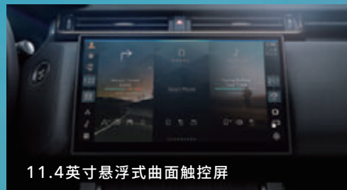
11.4英寸悬浮式曲面触控屏